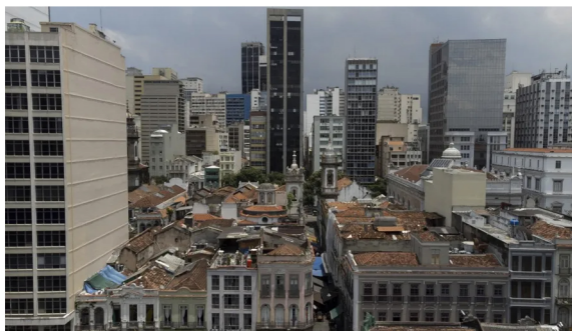
A região do Centro, onde a prefeitura tem incentivado o mercado imobiliário

O fundo Opportunity, do ramo imobiliário, passaram a reclamar, na Justiça, sobre a regulamentação de um dos prédios adquiridos por meio do projeto Reviver Centro, da Prefeitura do Rio. De acordo com o Opportunity, 200 proprietários de imóveis no número 95 da Rua Visconde de Inhaúma estão impossibilitados de obter as escrituras devido a exigências administrativas feitas pelo município.